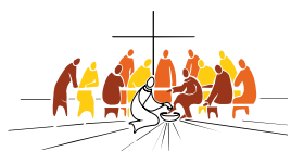
Communauté du Chemin Neuf

La Communauté du Chemin Neuf est une communauté catholique à vocation œcuménique, active dans 26 pays. Elle regroupe des hommes et des femmes, couples et célibataires consacrés désireux d'annoncer la Bonne Nouvelle du Christ. Elle a pour principale mission de former des chrétiens pour les soutenir dans l'Église et la société. Dans ce sens, à Chartres, elle a fondé un studium de philosophie.